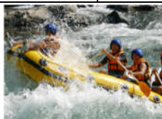
日本三大急流の一つである球磨川は緩急が激しくラフティングを楽しむのに最適な急流で、大自然を思う存分楽しむ事が出来ます。球磨川は全国的にも人気のラフティングスポットです。