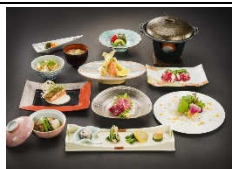
城見櫓は熊本の中心に位置する食事処です。熊本城の景色とともに熊本郷土料理で皆様をおもてなしします。館内からは各階層ごとに違った熊本城をご覧頂けます。