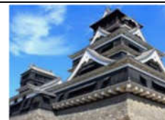
平成28年熊本地震からの復興のシンボルとなる、熊本城天守閣が震災前の姿によみがえりました。熊本城をより強固にかつしなやかに揺れから守るため、制震装置や石垣補強技術などが開発されました。