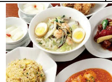
「中国名菜 紅蘭亭」では熟練のシェフによる オーセンティックな本格中華料理と熊本の郷土料理、太平燕をお召し上がりいただけます。