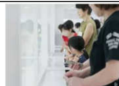
再春館製薬所。阿蘇の伏流水と厳選した素材から生まれる化粧品「ドモホルンリンクル」の工場を見学できます。東京ドーム6個分の敷地内では、製品の製造から販売、日本全国・海外への発送が行なわれています。