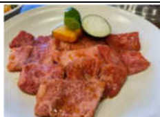
正園は、地元産直の絶品の黒毛和牛をメインに提供しています。肉質の良いカルビ、ロース、タンが柔らかくジューシーだと評判です。ホルモンは脂分が豊富でプリプリです。