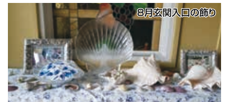
毎月毎に飾り付けを変え生徒さんに四季の大切さを伝える

家族は主人、長男、次男、三男、長女です。主人は45年前からペットショップとペットの美容室をやっています。今は長男も一緒です。次男は東京で獣医、三男は東京でバレエ指導を、長女と私がフジタバレエ研究所です。