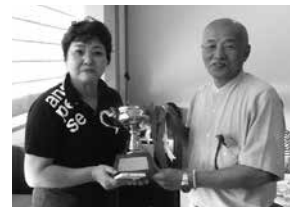
優勝カップの贈呈(向かって左側が麻生氏)