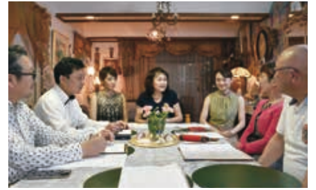
インタビュー中の一コマ

世で果たすべき役割を持って生まれてくる」という言葉を頂きました。“私の役割は何だろう”と考えた時に、父から受け継いだ教え、バレエを通して学んだ「人として美しい生き方」を若いスタッフや生徒さんに伝えていくことが私の役割ではないかと思うようになりました。例え役職や立場が変わろうとも最期の瞬間まで私に与えられた役割を果たして参ります。