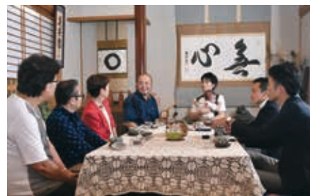
インタビュー中の一コマ

中村 そうですね。元々は日本家屋は床下に風が流れ、襖や障子で仕切ることで換気性が非常に良かったんですよ。それが近年になるとマンションなどの