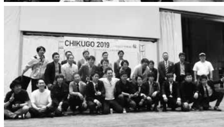
プロジェクトメンバーのみなさんありがとうございました。

今年も会員企業の社員の皆様にご協力頂き、運営の中心となる11名のプロジェクトメンバーの企画運営のもと、「つなげよう中経協の輪」というタイトルで、社員コミュニケーション事業を開催致しました。昨年のメンバーの方々の礎があり、昨年参加された方々の声を活かし、助けて頂きながら今年の企画、運営を進める事ができました。様々な会社スタッフの方々と多くの交流をしてもらいたいという想いで今年もテーブル毎にバラバラに座ってもらい交流を深める取り組みにしました。食事は温かいものも食べてもらいたいと、おでんや豚汁。人気のケバブ、ケーキバイキング、オードブル…などを準備し、飲み放題でした。並ぶのが大変だった、ケーキが食べられなかった等の課題も残りましたが、多くの方が美味しかった、良かったと言って頂きました。交流を深めるために〇×クイズ、ダンボールを使用したダンダンダンというレクリエーションを開催しました。多くの方々が交流を深め、笑顔でいる姿を見る事もできました。