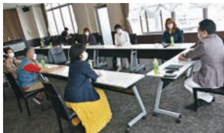
インタビュー中の一コマ

やはり経営者がしっかり従業員を教育する事が絶対に必要です。うちも早くにポールを立ててビニールシートを張る準備をしていたんですけど、なぜそこまでしなくてもいいかなと実は思いました。しかし自分が罹るのもこわいし、逆にお客様にうつすのも怖いんです。