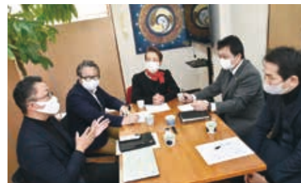
インタビュー中の一コマ

の特設HPの制作やTVCMなども制作させていただきました。全国選抜高校テニス大会のHPやアプリの開発や運用も担当させていただき、毎年3月に博多で開催される全国選抜高校テニス大会の際は、リアルタイムの速報も柳川高等学校の生徒さんに手伝ってもらいながらやっています。ちょっとでも間違うとクレームが入るので緊張感が半端ないです。それと、柳川高等学校のメディア戦略チームのメンバーとしてHPやポスター、パンフレット制作なども担当させて頂いております。