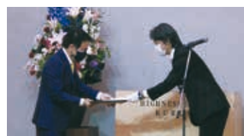
最前会長への感謝状授与