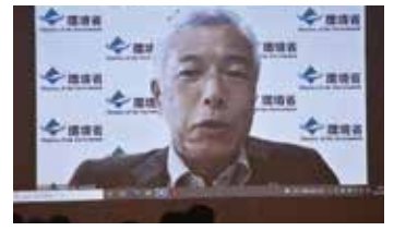
講師:環境省 環境事務次官 中井 徳太郎氏