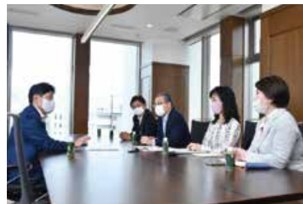
インタビュー中の一コマ

銀行・証券・保険の金融業界で、特に代理店が活躍しているのは保険業界です。保険の場合、保険会社とお客様の間で利益相反するケースがありますので、その間に存在する代理店の意義を考え続けなければなりません。当社では、その存在意義を情報提供と事故対応だと考えています。最終的には、お客様が何を求めているか