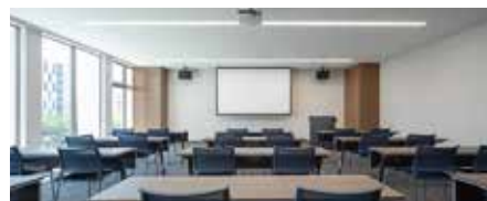
4階セミナールーム

趣味といえるほどではありませんが、ラグビー観戦や旅行が好きです。ここ数年は、子供と一緒に過ごせるのも今だけだろうと考えて、週末は子供との時間を大切にしています。まだ小さいので、近くの公園に遊びに連れて行ったり、魚釣りを楽しんだりしています。もう少し大きくなったら、一緒にキャンプなどをしたいですね。