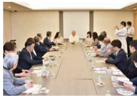
インタビュー中の一コマ

奥様 いい意味でも、悪い意味でもあります。ただですね、これは神社だからそうなのかなと思うこともありますが、神社と