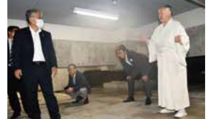
社殿地下の免震構造を説明される有馬宮司