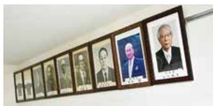
受け継がれる企業精神