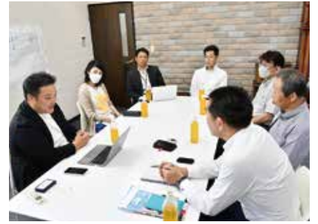
インタビュー中の一コマ

家づくりという目の前にあるものを横並びで相談しながら「ここ、こうしたほうがいいんじゃないですか」ということを心がけています。