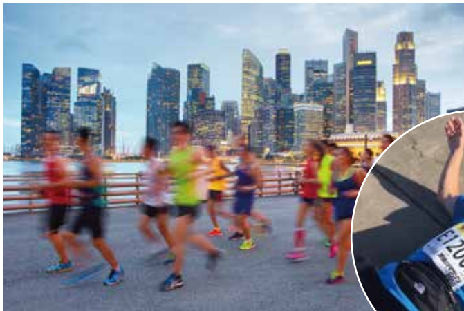
シンガポールマラソン(イメージ)

完走した大会は、指宿菜の花マラソン2回、熊本城マラソン2回、筑後川マラソン1回、シンガポールマラソン1回の計6回です。しかし2020年からのコロナ禍以降、フルマラソンからは遠ざかってしまいました。