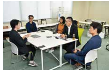
インタビュー中の一コマ