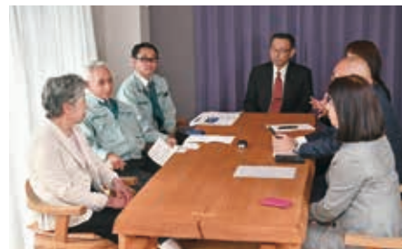
インタビュー中の一コマ

林社長 素人でもできるように、DIYの道具をメーカーさんがたくさん販売されています。簡単な道具で床の張替えなどできるようにってきています。ただ、我々のような業種では、完全なロボット化は難しいと思います。アパートなどハウスメーカーさんのモノは、女性が組み立てるケー